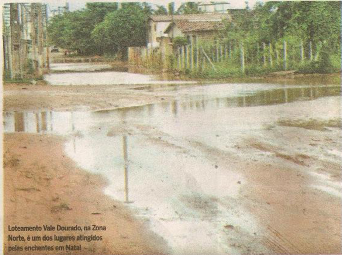
Loteamento Vale Dourado, na Zona Norte, é um dos lugares atingidos pelas enchentes em Natal

O plano prevê a execução de obras em todas as zonas da cidade. O maior projeto vai ser a substituição do sistema de bombeamento das lagoas de captação na zona sul de Natal por um sistema integrado de túneis que vai transferir o excesso de água das lagoas de captação através da ação da gravidade, orçado em R$ 280 milhões. Segundo o autor do projeto, professor João Abner, o sistema vai interligar as lagoas de captação Preá, Potiguares, Jacaré, São Conrado, do Centro administrativo e de Cidade da Esperança.