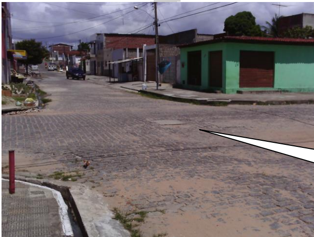
VISÃO DO PV'S NOS CRUZAMENTOS DA RUA LARANJAL COM A RUA DA DIVISÃO