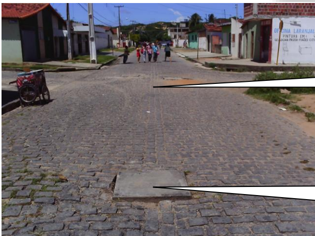
PV'S NO CRUZAMENTO DAS RUAS LARANJAL E DA DIVISÃO