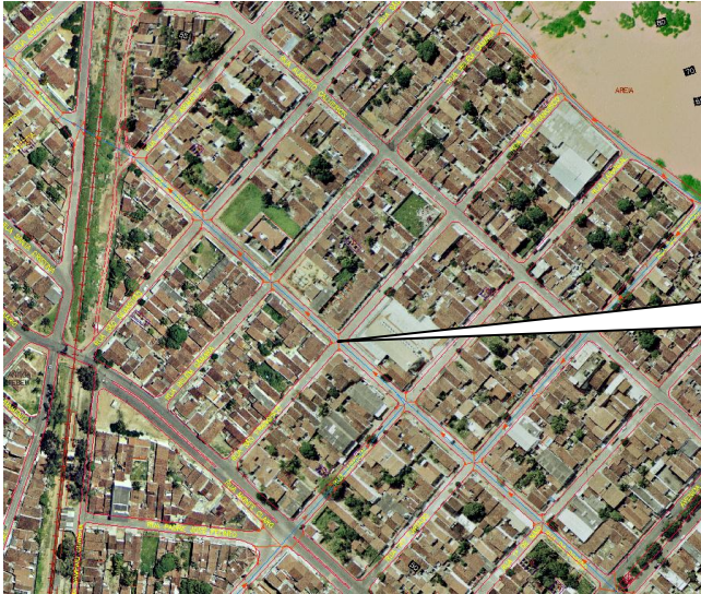
IMAGEM AÉREA – RUA LARANJAL COM A RUA DA DIVISÃO