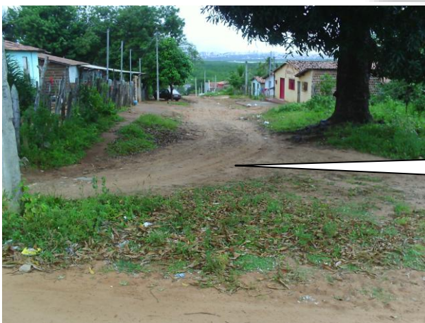
RUA CARTEIRO SIQUEIRA NO CRUZAMENTO COM A RUA SIQUEIRA CAMPOS