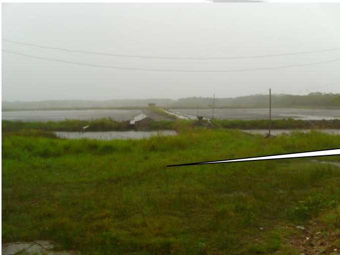
FINAL DA RUA CARTEIRO SIQUEIRA