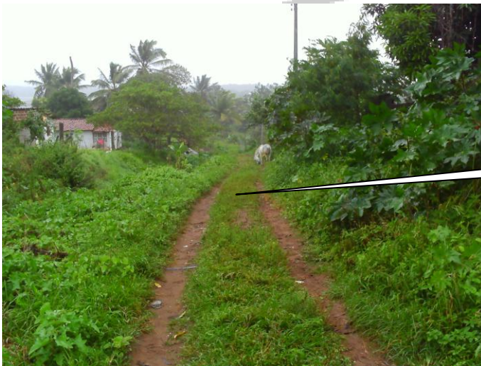
FINAL DA RUA CARTEIRO SIQUEIRA