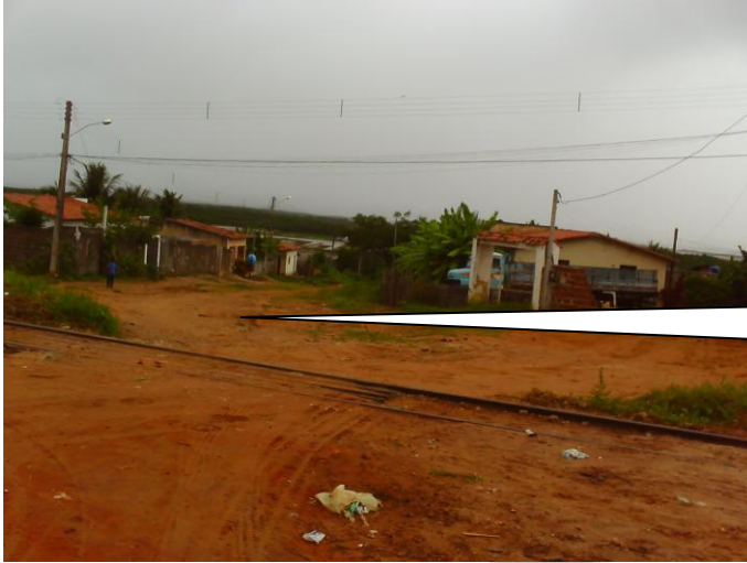
RUA TENENTE CLAUDIONOR AMARO DE OLIVEIRA NO CRUZAMENTO COM A RUA SIQUEIRA CAMPOS