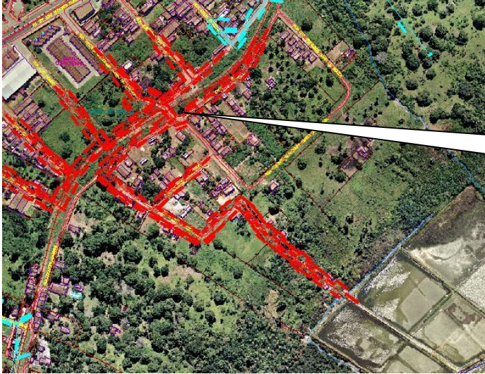
IMAGEM AÉREA – PONTO CRÍTICO 30 ZN – RUA SIQUEIRA CAMPOS