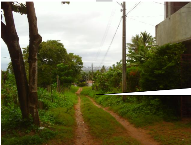
RUA ARTHUR BACURAL ENTRE A AV. DR. JOÃO MEDEIROS FILHO A RUA SIQUEIRA CAMPOS