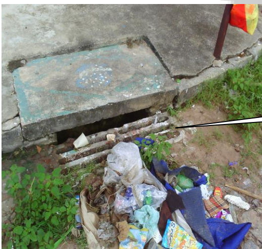
BOCA DE LOBO SENDO OBSTRUÍDA PELO LIXO