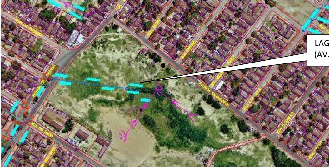
LAGOA DOS IDOSOS (AV. DAS CIRANDAS)