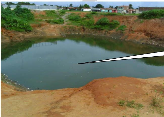
LAGOA DOS IDOSOS (AV. DAS CIRANDAS)