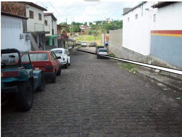
OCUPAÇÃO URBANA PRÓXIMA A LAGOA DO JIQUI