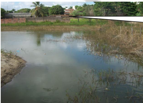
LAGOA DO JIQUI APRESENTA GRANDE PLANÍCIDE INUNDAÇÃO E OCUPAÇÃO DAS MARGENS