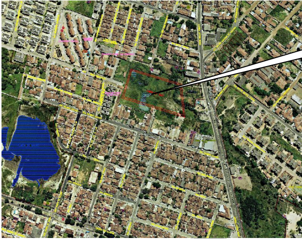
VISÃO ÁREA DA LAGOA DO JIQUI