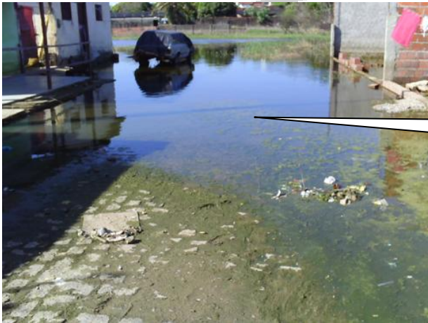
DETALHE DE INUNDAÇÃO DA LAGOA DO JIQUI NA ÁREA DE OCUPAÇÃO URBANA