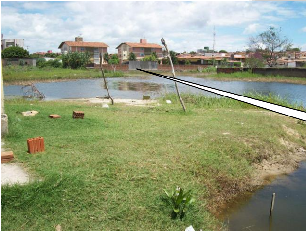
OCUPAÇÃO URBANA PRÓXIMA A LAGOA DO JIQUI