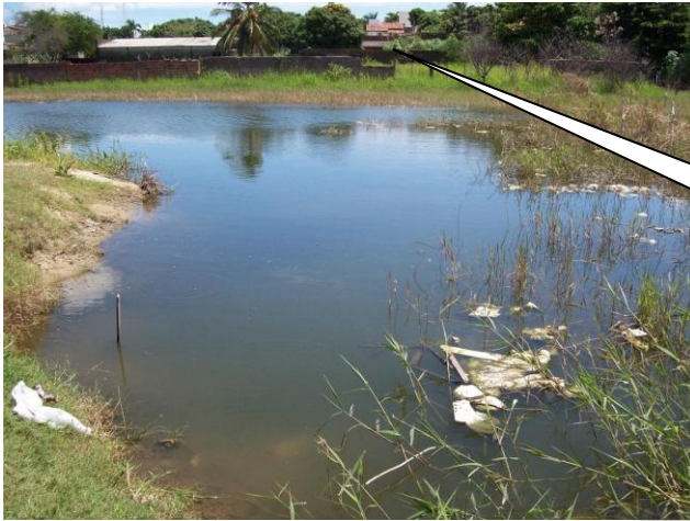
OCUPAÇÃO URBANA PRÓXIMA A LAGOA DO JIQUI

“Nossa missão é servir com excelência, ética e eficiência, contando com servidores competentes e valorizados, primando todos pelo respeito ao cidadão e ao meio ambiente, contribuindo para fazer de Natal uma cidade cada vez mais humana, socialmente mais justa, solidária e sustentável, com a melhor qualidade de vida para toda a população”.