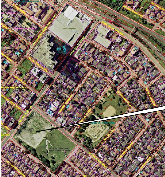
PONTO CRÍTICO – LAGOA DA AV. PRAIA DE GENIPABÚ (VISTA AÉREA)