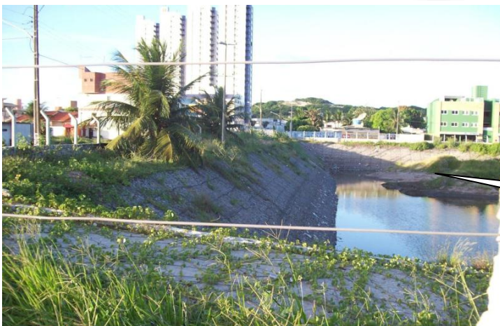
DETALHE DE AREIA ACUMULADA NA LAGOA REDUZINDO O VOLUME ÚTIL DA LAGOA