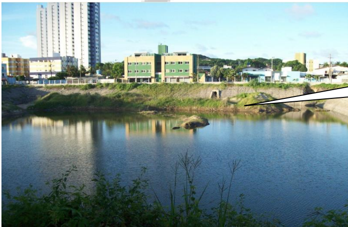
PRESENÇA DE GRANDE VOLUME DE AREIA E VEGETAÇÃO REDUZINDO O VOLUME ÚTIL DA LAGOA