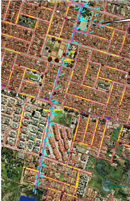
ACRÉSCIMO DE REDE DE DRENAGEM NA RUA PERNAMBUCO