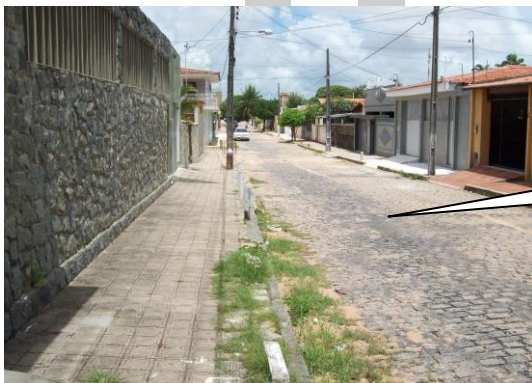
TRECHO DA RUA PERNAMBUCO A SER ACRESCIDO GALERIA DE DRENAGEM