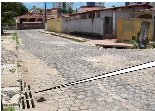
SISTEMA DE DRENAGEM IMPLANTADO ENTRE AS RUAS PARAÍBA E PERNAMBUCO