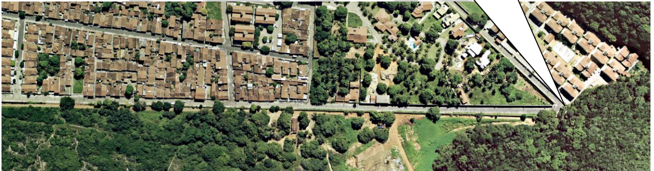
PONTO DE INUNDAÇÃO DA RUA AURIS COELHO