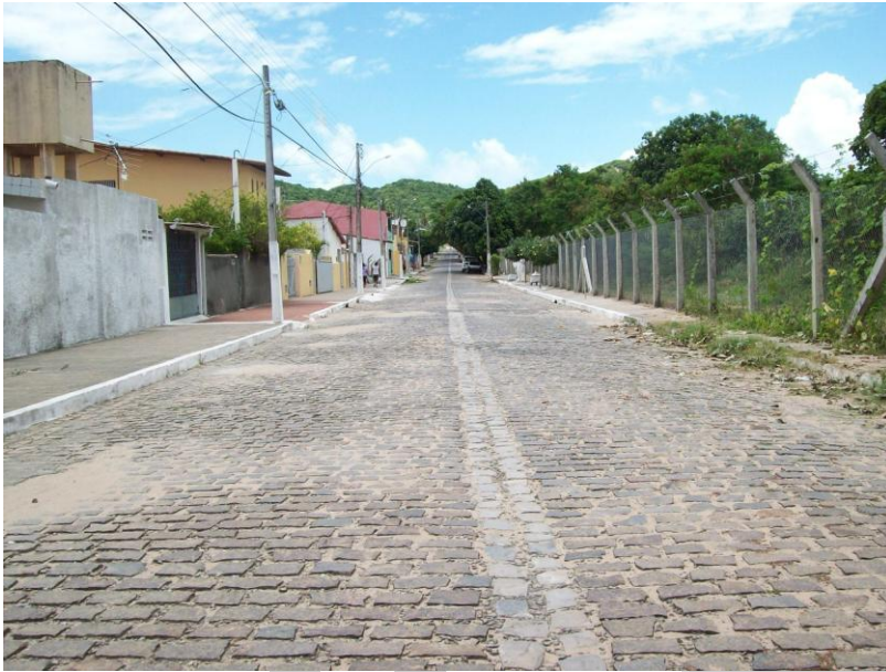
RUA AURIS COELHO

"Nossa missão é servir com excelência, ética e eficiência, contando com servidores competentes e valorizados, primando todos pelo respeito ao cidadão e ao meio ambiente, contribuindo para fazer de Natal uma cidade cada vez mais humana, socialmente mais justa, solidária e sustentável, com a melhor qualidade de vida para toda a população".