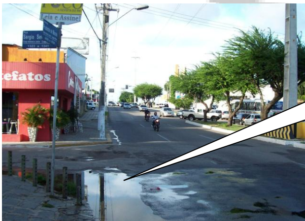
PONTO DE ALAGAMENTO NA AVENIDA PRUDENTE DE MORAIS PRÓXIMO A RUA SÉRGIO SEVERO (OUTRA VISTA)