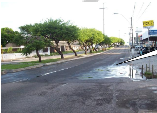
PONTO DE ALAGAMENTO NA AVENIDA PRUDENTE DE MORAIS PRÓXIMO A RUA SÉRGIO SEVERO