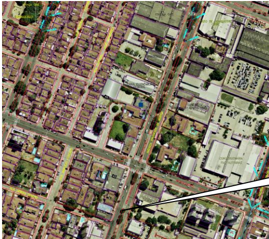
PONTO DE INUNDAÇÃO NA AV. PRUDENTE DE MORAIS PRÓXIMO A RUA SÉRGIO SEVERO